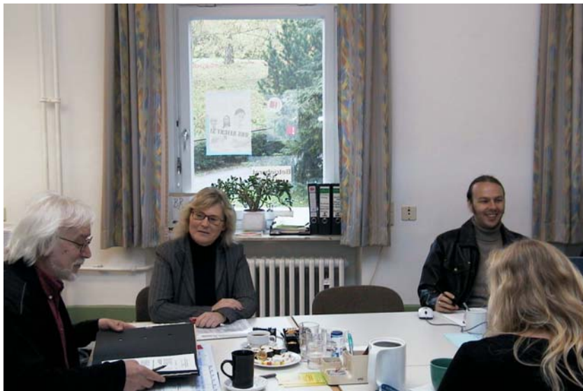
Das Foto zeigt die Mitglieder des Betriebsrats mit Christine Lambrecht.

Die Betriebsratsmitglieder und Christine Lambrecht äußerten aber übereinstimmend die Hoffnung, dass diese Maßnahmen die Situation im ZSP Bergstraße und in anderen Kliniken verbessern werden und beschlossen, in regelmäßigem Kontakt zu bleiben.