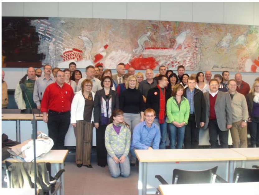
Das Foto zeigt die Gruppe mit Christine Lambrecht im Sitzungssaal der SPD-Bundestagsfraktion.

Am Ende der Diskussion dankten die Gäste Christine Lambrecht für die Möglichkeit, an der Reise teilzunehmen und verabschiedete sich zum nächsten Termin.