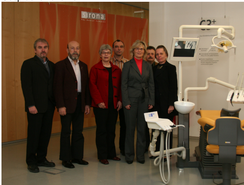
Das Foto zeigt Christine Lambrecht mit Mitgliedern des Sirona-Betriebsrates.

Die Sirona-Betriebsratsmitglieder vereinbarten mit Christine Lambrecht, in engem Kontakt zu bleiben und regelmäßige Gespräche zu führen.