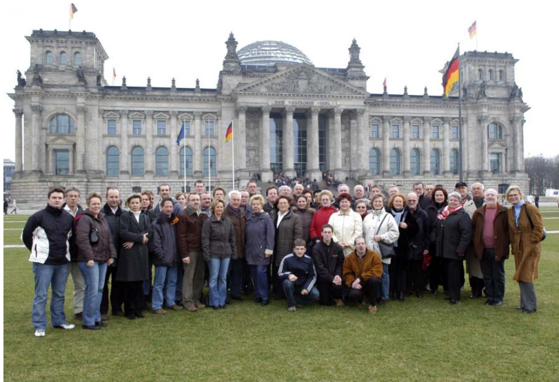
Das Foto zeigt die Gruppe mit Christine Lambrecht vor dem Reichstagsgebäude.

Die Kerweabteilung traf Lambrecht einer weiteres Mal bei einem gemütlichen Essen fand am darauf folgenden Samstag im Kronprinzenpalais Unter-den-Linden, bevor die Gruppe ihre Reise mit einer Besichtigung des Schlosses Sanssouci abschloss und den Heimweg antrat.