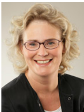
Christine Lambrecht MdB

Wir werden jetzt das Gesetzgebungsverfahren zügig zum Abschluss bringen“, so Lambrecht.